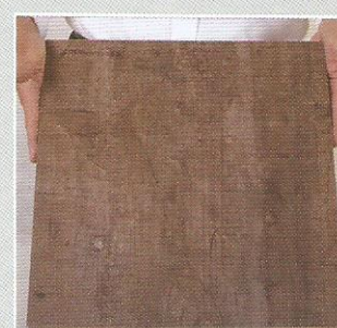
8- Seu projeto está pronto