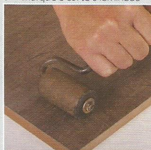
7- Para não formar bolhas, faça pressão sobre o laminado