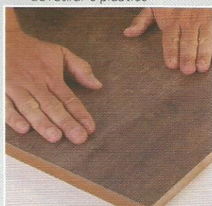
6- Pressione o laminado