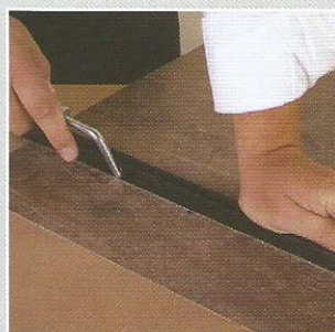
3- Marque e corte o laminado