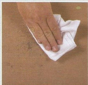
1- Limpe a área a ser revestida