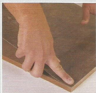
5- Posicione sobre o local a ser revestido